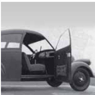
Porsche Typ 12, ausgestellt im Museum Industriekultur in Nürnberg.