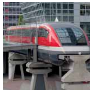
Der Transrapid – ein Verkehrskonzept mit Zukunft.