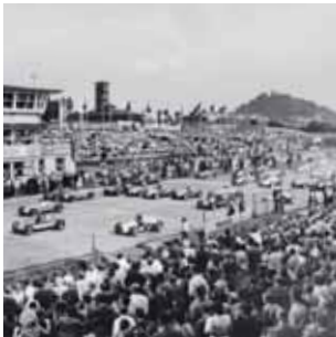
Eröffnung des Nürburgrings.