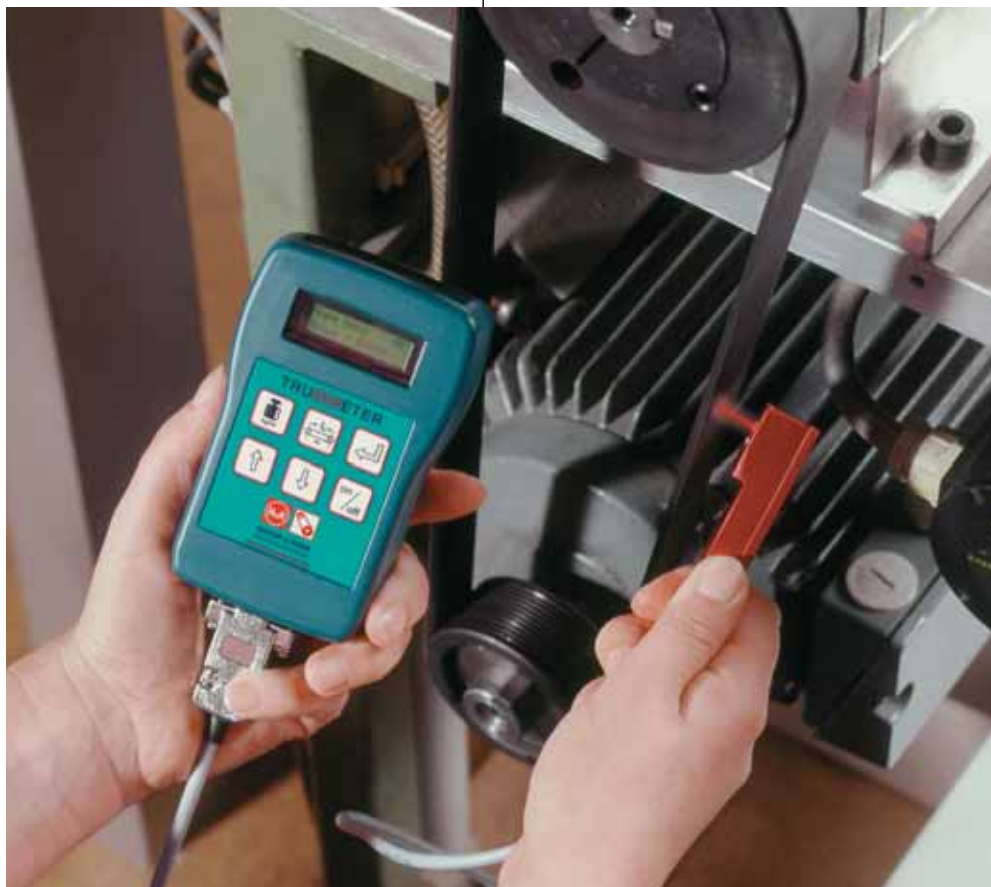
Mess- und Riemenspannung mit TRUMMETER