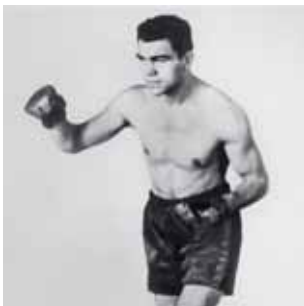
Max Schmeling wird Europameister im Halbschwergewicht.