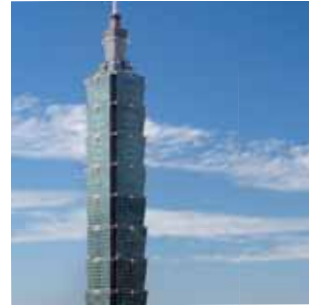
Einweihung des höchsten Gebäudes der Welt. Das Taipeh 101 in Taiwan – 508 Meter hoch.

Hilger u. Kern / Dopag Gruppe – der leistungsstarke Partner an Ihrer Seite!